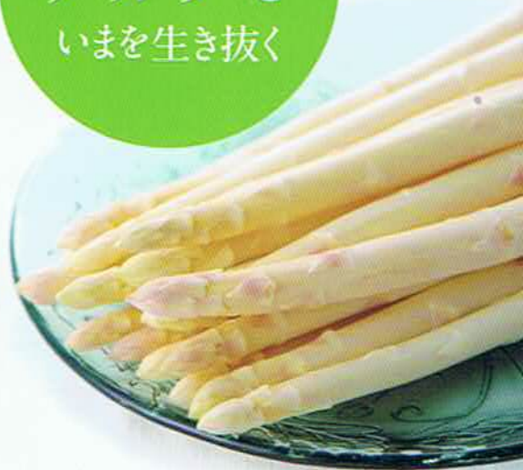
香川県 うえむら農園の ホワイトアスパラガス