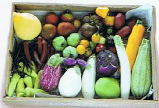
香川県 コスモファームの イタリアン野菜