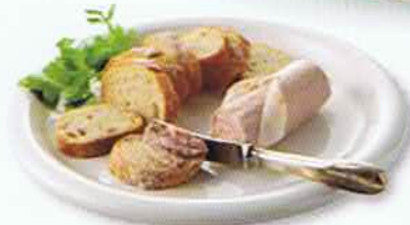
長野県 シュタンベルクの レバーペースト