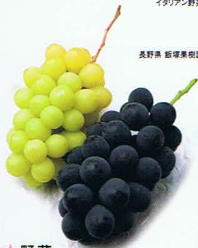
長野県 飯塚果樹園のぶどう