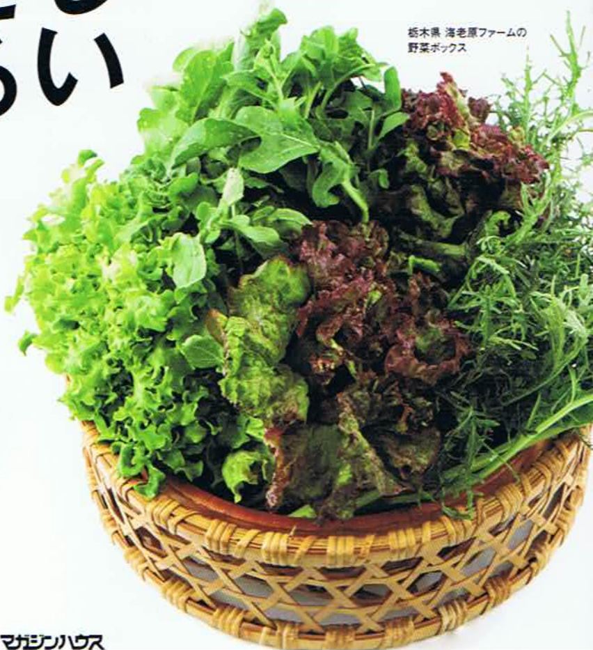
栃木県 海老原ファームの 野菜ボックス