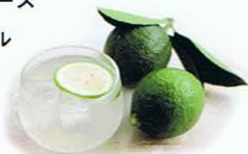
熊本県 鶴田有機農園のグリーンレモン