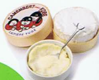
兵庫県 弓削牧場のチーズ